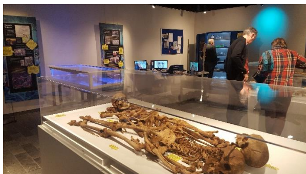
Foto: Tentoonstelling Archeologiemuseum Huis van Hilde te Castricum.