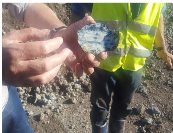
Foto: Opgraving in Warder