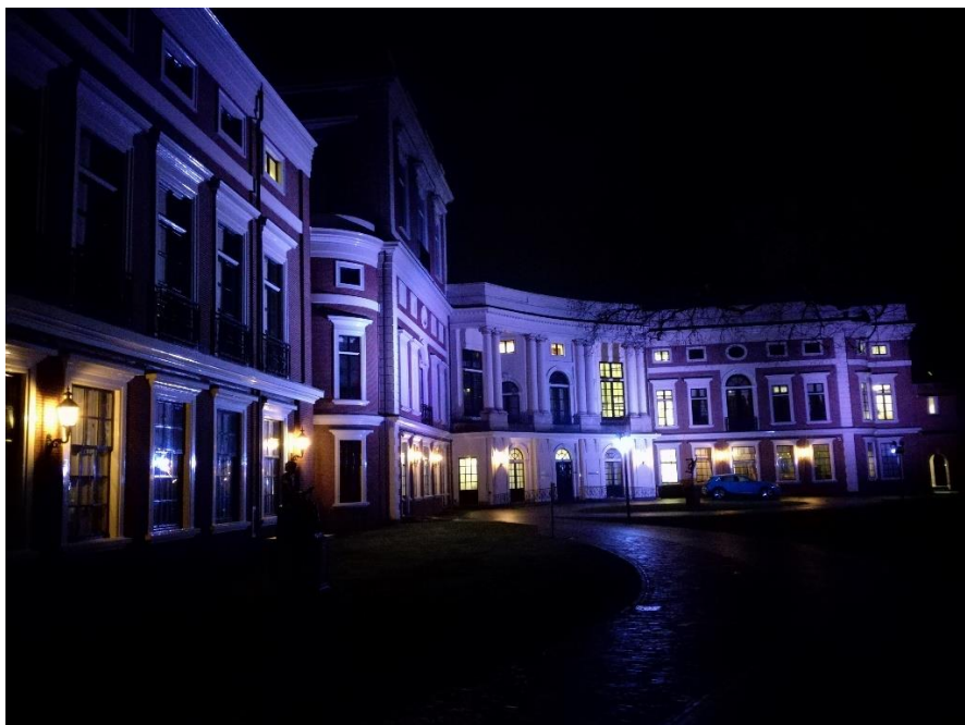
Foto: Het provinciehuis te Haarlem.

Lees hier haar column in zijn geheel terug.