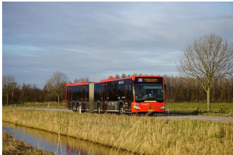
Foto: Buslijn 300 van R-net

Het openbaar vervoer in Noord-Holland takelt in rap tempo af. In eerdere edities van dit nieuwsbulletin werd hier al aandacht aan geschonken. Ook nu weer krijgt de SP-statenfractie signalen dat het busvervoer in onze provincie steeds vaker te wensen overlaat.