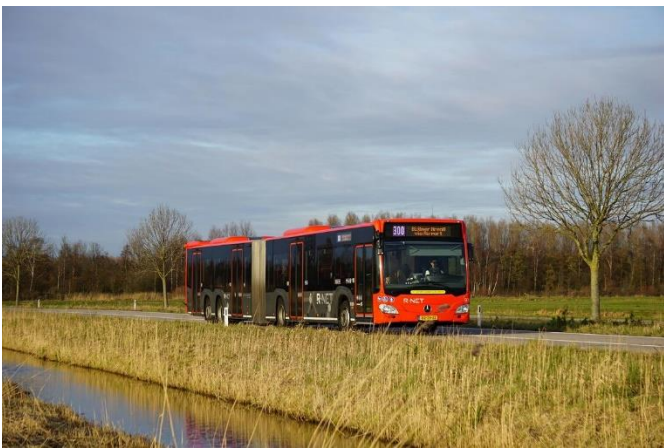
Foto: R-net buslijn 300