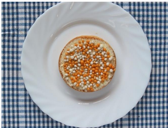
Foto: Beschuut met oranje muisjes.

Anna de Groot: "Dat heeft dus niets met zelfbeschikking te maken. De SP zal altijd blijven strijden voor dit soort vrijheden en tegen discriminatie. We zijn dan ook erg blij met dit initiatief."