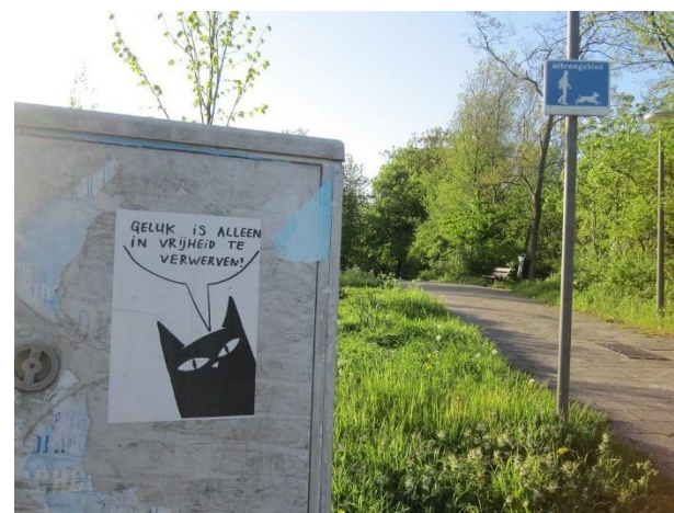
Foto: Poster met de tekst "Geluk is alleen in vrijheid te verwerven!"

Remine Alberts Wim Hoogervorst Heidi Bouhlel