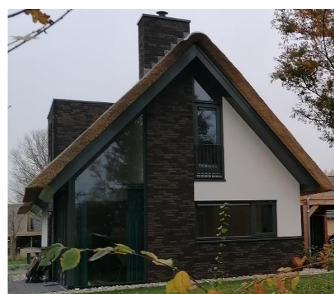
Foto: Vakantievilla in Schoorl.

Lees het hele artikel hierover op onze website . Via de site tref je ook de Statenvragen aan.