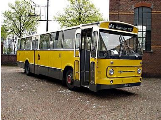
Foto: Oude gele bus.

Op dit moment hebben ruim 300 SP-leden de OV-enquête ingevuld; waarvoor onze grote dank! Als je de enquête nog niet hebt ingevuld, dan kan dat nog tot en met aanstaande zondag via de rode knop hieronder.