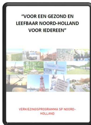
Foto: Voorblad concept verkiezingsprogramma.

Ben je nieuwsgierig naar het programma en wil je meepraten over de inhoud? Neem dan contact op met je afdelingsvoorzitter. Via deze link kun je de benodigde contactgegevens vinden.