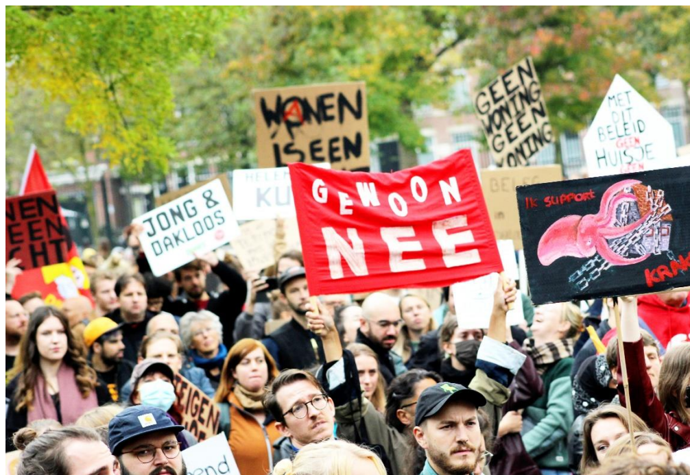
Foto: Woonopstand Rotterdam, 17 oktober 2021.

Je bent vast nieuwsgierig geworden naar de rest van Remine haar column. Klik op de onderstaande foto en lees de column op de website!