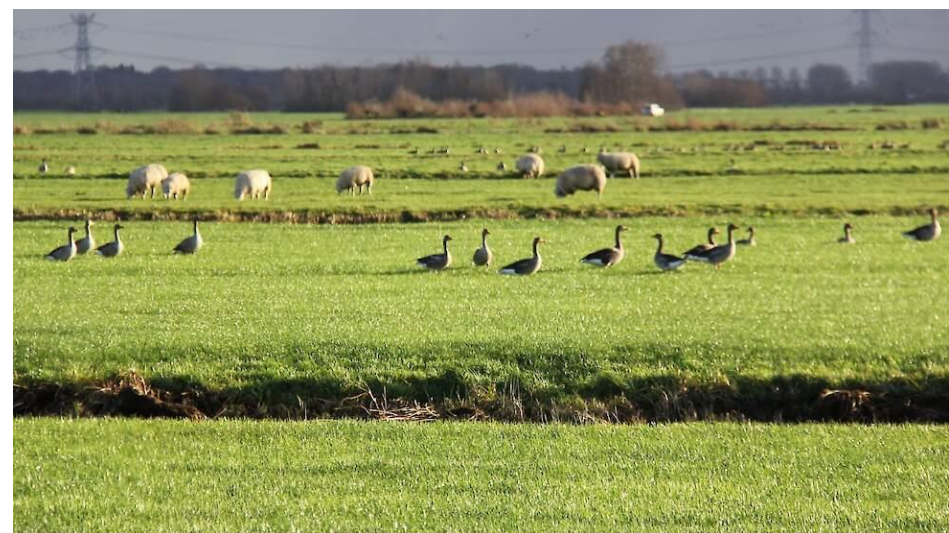
Foto: Ganzen en schapen in de polder