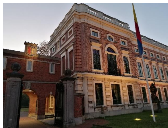
Foto: Ingang provinciehuis, Herfst 2022.