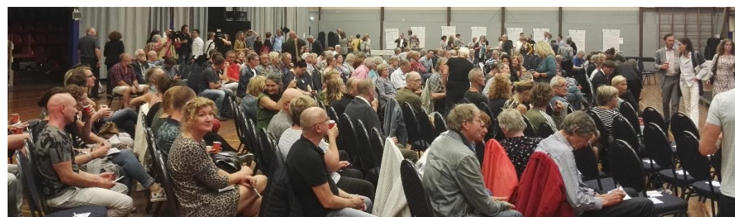
Foto: Bewonersavond Wijk aan Zee, juni 2019.

Bekijk het hele debat hier terug. (klik in de lijst tweemaal op agendapunt 4a voor het debat en tweemaal op 4b voor de insprekers)