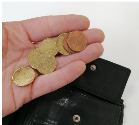
Foto: Kleingeld. 'Elk dubbeltje moeten omdraaien' is een bekend gezegde.

'Geld moet rollen' is een bekende uitspraak die je vooral in ondernemersland hoort. Wanneer geld rolt, gebeuren er mooie dingen, zegt men. Op zich is dat natuurlijk waar. Stop het in een oude sok, verberg het onder je matras of bewaar het in een la en je zult zien dat er niets verandert.