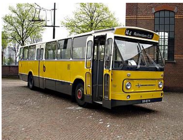
Foto: De bekende gele bus. Lijn 144 naar Rotterdam Centraal

Doe vooral mee de komende tijd en houd je op de hoogte via je afdeling!