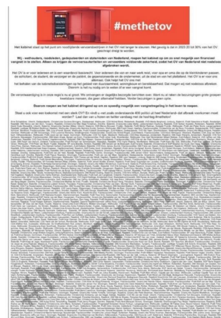
Foto: Deze brandbrief is op 30 juni jl. overhandigd aan Staatssecretaris Vivianne Wijnen.

Vandaag is er een artikel verschenen via de NOS met als titel: “ANWB verwacht blijvende drukte op de weg: ‘Vaker bumper aan bumper’”. Volg deze en andere ontwikkelingen live via Facebook en Twitter. Help mee de maatschappelijke druk te vergoten en gebruik daarbij de hashtag #MetHetOV en vertel waarom investeren in het OV hét SP-alternatief is!