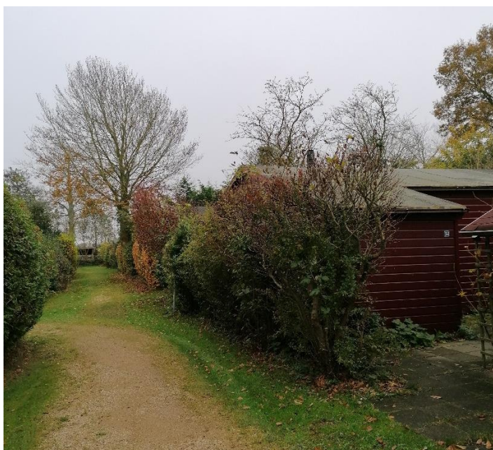
Foto: Het ‘groene pareltje’ dat Carpe Diem heet; een chaletpark in de gemeente Bergen