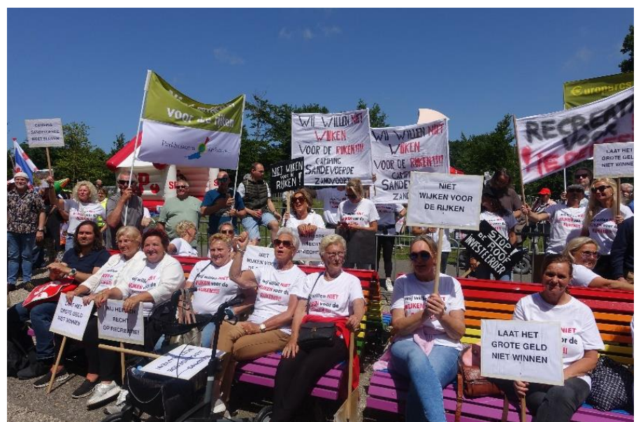
Foto: 11 juni, Landelijke demonstratie tegen het opkopen van vakantieparken