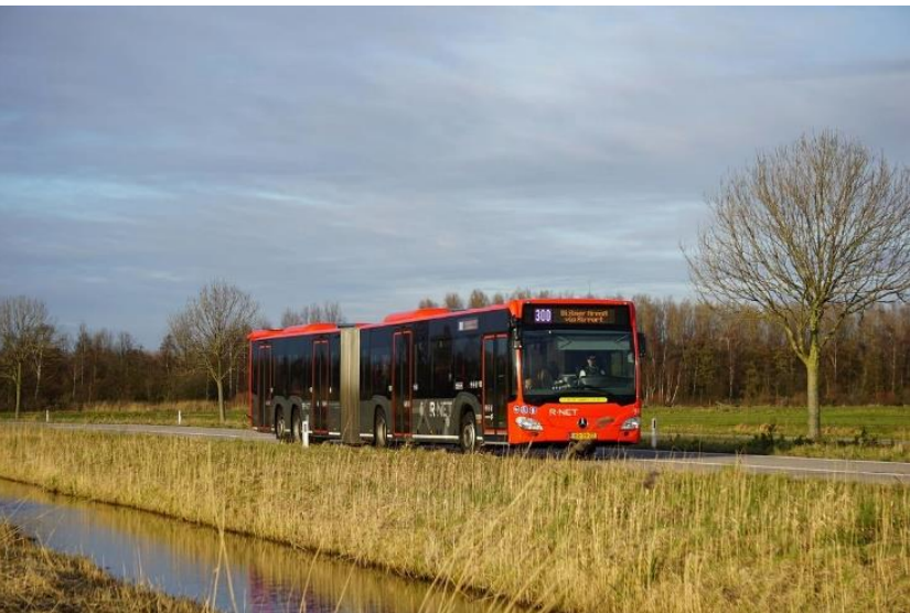
Foto: R-net buslijn 300