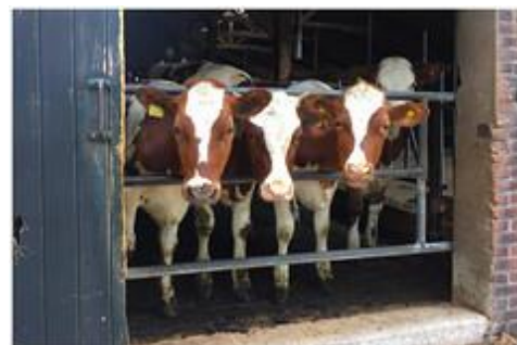
Foto: Koeien in een stal.

Wil je de statenvragen lezen, of heel het artikel raadplegen? Klik dan hier.