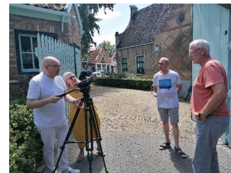
Foto: 16 juli, deelnemers leren cameratechnieken tijdens de introductie op de workshop.

Lees het allemaal in het wekelijkse nieuwsbulletin en spreek ons aan op één van de vele SP-bijeenkomsten. In de tussentijd kun je terecht op onze mooie website en kun je ons actief volgen op Facebook en Twitter (zie het kader hiernaast).