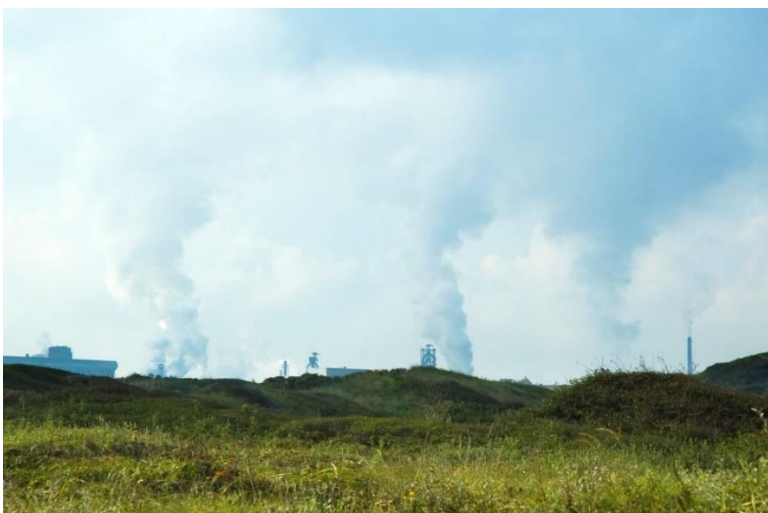
Foto: Tata Steel in de Kennemerduinen.

Lees het artikel op onze site en bekijk de SP-statenvragen.