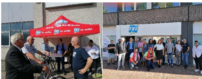
Foto's: In gesprek en op de foto met enkele van de tientallen stakers.

SP’ers zijn door heel het land bij de stakers in het openbaar vervoer op bezoek om steun te betuigen. De SP hoopt van harte dat al deze medewerkers hun eerlijke deel krijgen, het werk weer plezierig wordt en dat men er weer trots op kan zijn.