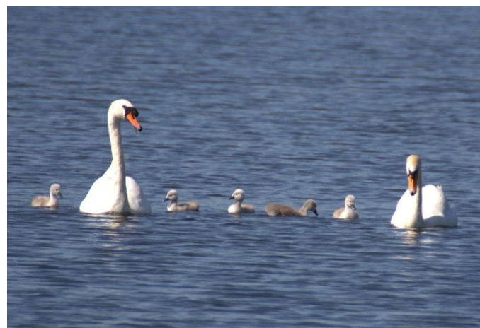
Foto: Knobbelzwanen en hun kroost.