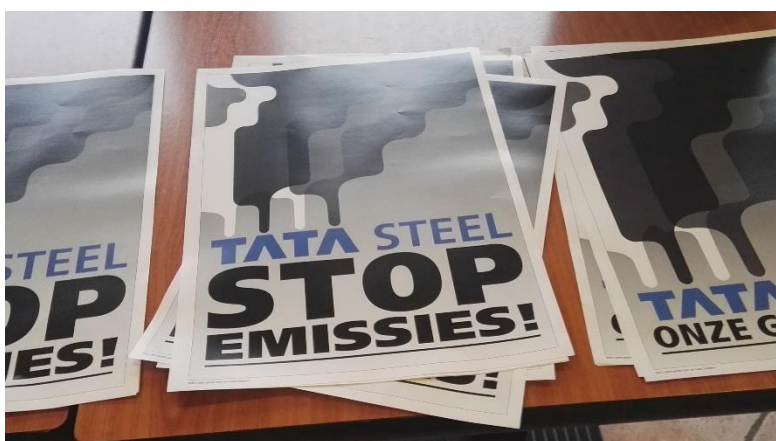
Foto: Flyers bij een bewonersavond in Wijk aan Zee.

Lees het hele bericht op onze site en hoor het schrijnende verhaal van een inspreker (bewoonster Wijk aan Zee) tijdens de commissievergadering van afgelopen maandag.